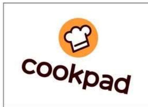
ロゴのレイアウトを変える