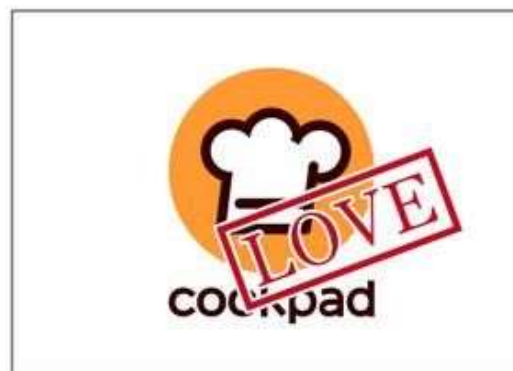
オブジェクトを重ねる