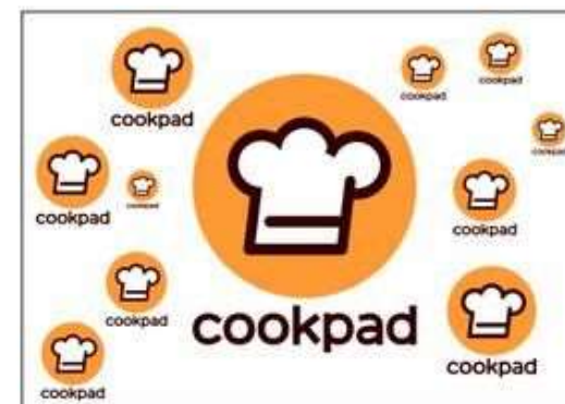
同時に複数個使用する