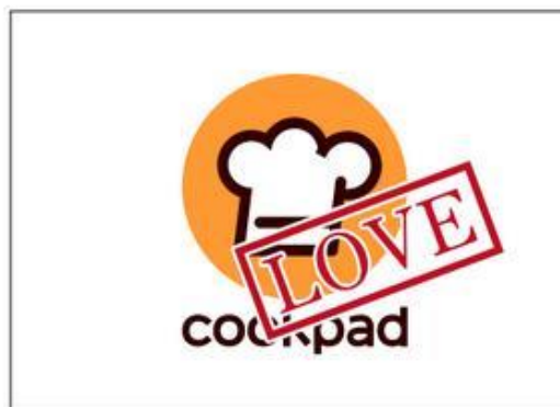
オブジェクトを重ねる