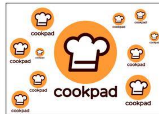
同時に複数個使用する