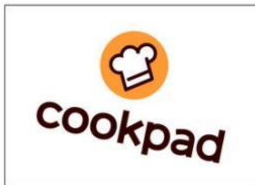
ロゴのレイアウトを変える