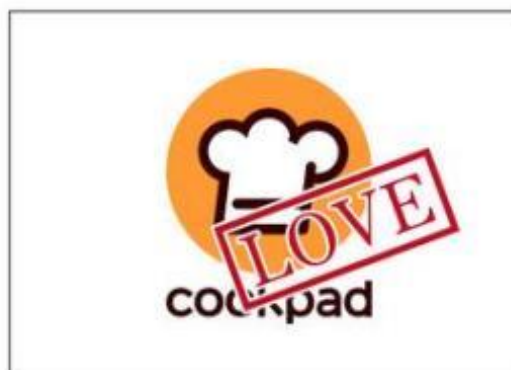
オブジェクトを重ねる