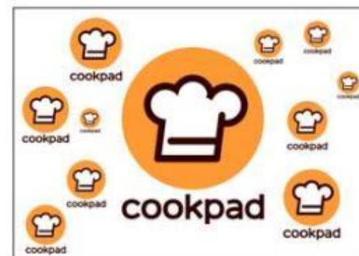
同時に複数個使用する